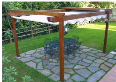
Fig. 6 _ pergolato

Si intendono le strutture (esemplificativamente vedi fig. 4, 5 e 6) di cui all'art. 6 delle Norme Tecniche di Attuazione del PRG [superficie lorda massima di mq. 15 misurata agli appoggi ed altezza lorda massima di m 2,70] realizzate con materiali leggeri (legno, metallo, plastica) fissate al suolo con staffe e viti, con funzione di sostegno per rampicanti o coperte con materiali leggeri ancorchè rigidi [canna palustre, tessuto, rete ombreggiante o antigrandine, telo in PVC o materiale bituminoso, tegole canadesi, lastre di policarbonato] aventi funzione di ombreggiamento. Tali strutture possono essere costruite isolatamente, o poste in aderenza alla facciata del fabbricato per un solo lato o per due lati nel caso di realizzazione del manufatto in prossimità di un angolo del fabbricato.