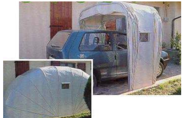
Fig. 3 _ box auto a chiocciola

Per questo tipo di opere non è richiesta alcuna autorizzazione in quanto attività edilizia libera (art.6 DPR 380/2001).