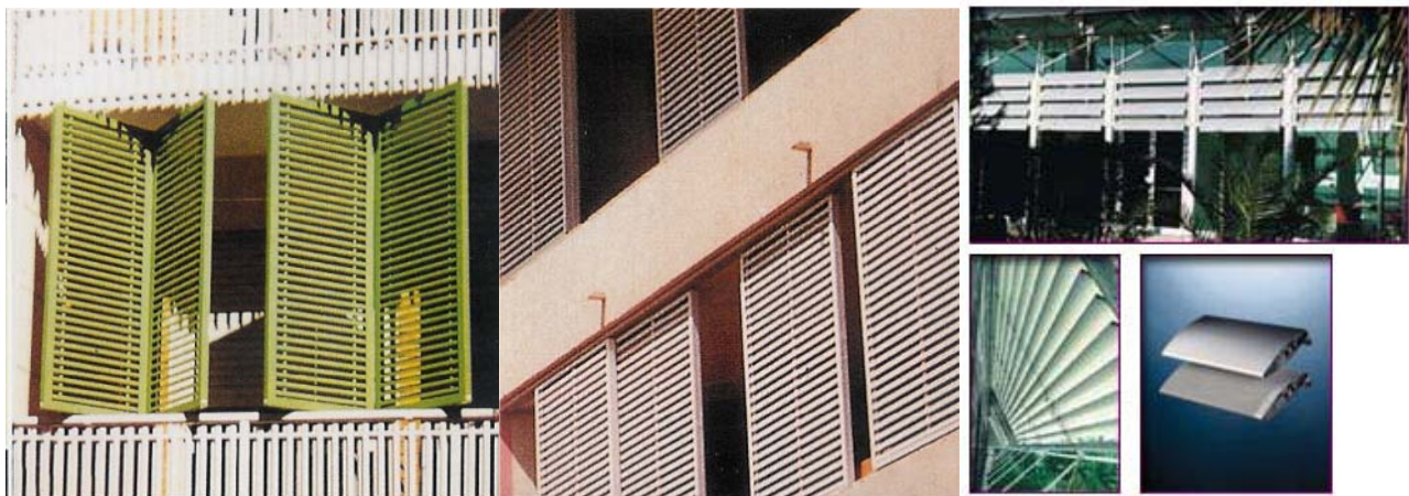
Fig. 12 _ esempi di strutture frangisole rigide regolabili

Si intendono quelle strutture verticali rigide destinate esclusivamente a fungere da riparo dall'irraggiamento solare diretto alle facciate e alle aperture dei fabbricati. Dette strutture devono essere rimovibili e apribili, e possibilmente regolabili al fine di regolare il filtraggio della luce solare (esemplificativamente fig. 12).