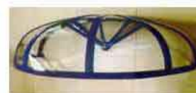
Fig. 10 _ pensiline in polycarbonato con

Si intendono le strutture sporgenti a sbalzo dal prospetto degli edifici con funzione di deflettore per la pioggia, solitamente poste sopra le porte di ingresso principale (esemplificativamente vedi fig. 8, 9 e 10)