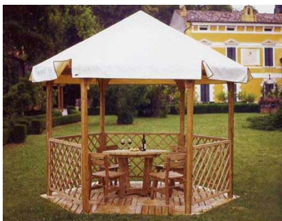
Fig. 4 _ gazebo