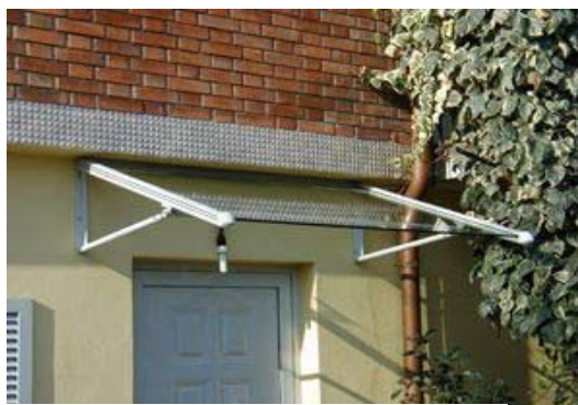
Fig. 9 _ pensilina con copertura in vetro