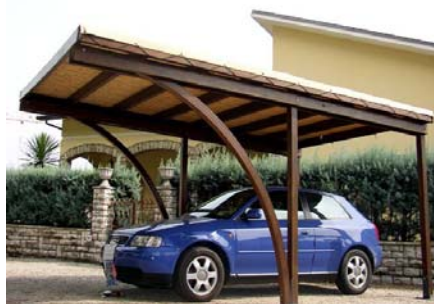
Fig. 5 _ car port