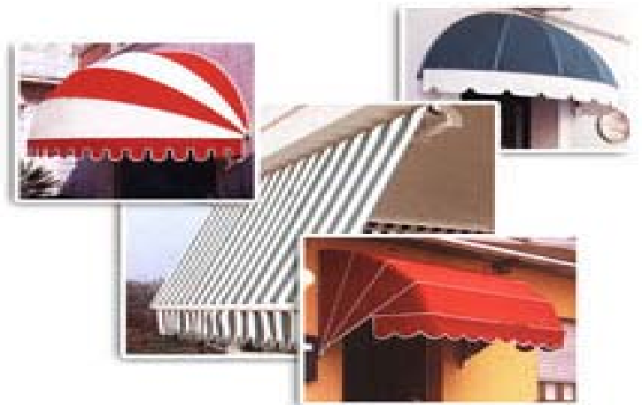
Fig. 11 _ tende solari di varie forme

Si intendono le strutture sporgenti a sbalzo al prospetto degli edifici con funzione di riparo per l'irraggiamento solare, necessariamente dotate di dispositivo di chiusura manuale o automatico e struttura retrattile (esemplificativamente vedi fig. 11).