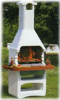
Fig. 1_ barbecue

ingombro massimo di 1,00 mq, anche dotate di cappello convogliatore dei fumi e camino, destinate esclusivamente alla cottura di cibi consumati nella residenza. E' ammessa la sola combustione di legna o carbone di legna.