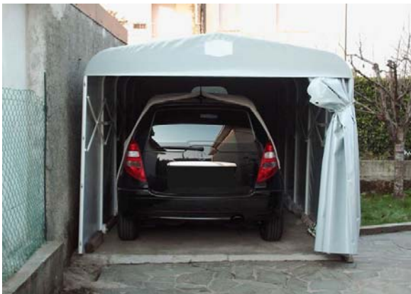
Fig. 2 _ box auto a pantografo

Si intendono le strutture (esemplificativamente vedi fig. 2 e 3) realizzate con telaio in acciaio o alluminio centinate con tela di colore chiaro impermeabile e con sistema di chiusura "a scomparsa", quindi retrattili, destinate ad accogliere automezzi, delle dimensioni massime di 14,00 mq ed un'altezza massima di m 2,00. Può essere realizzato un solo box per alloggio.