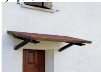
Fig. 8 _ pensilina con copertura in legno e tegola canadese